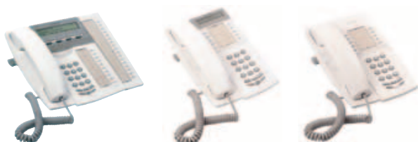
Dialog 4223 Professional